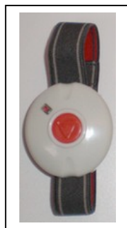
Déclencheur / Bip alarme