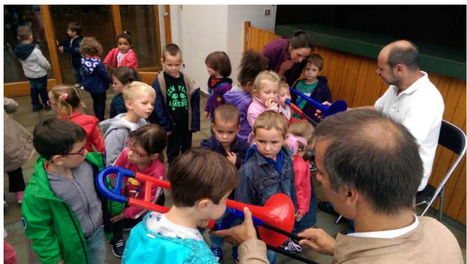
Image d'illustration : animation scolaire primaires – Ecueillé septembre 2015

Affirmant la volonté de l'OHDI de fédérer, de conforter l'esprit de complémentarité et de travail en symbiose avec les acteurs majeurs de la place, la Musique locale et son École de Musique, s'il y a lieu, sont, sans être impliquées directement, informées de la tenue de l'animation scolaire.