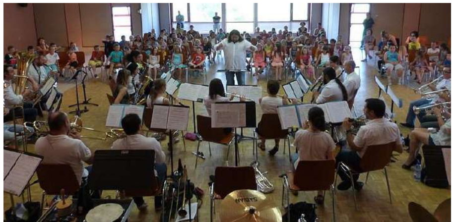
Image d'illustration : animation scolaire primaires – Ardentes juin 2014