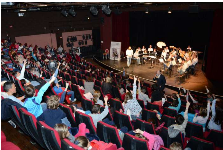
Image d'illustration : animation scolaire primaires – Châteauroux avril 2017

Un premier voyage dans le temps, à la découverte des divers instruments, leur évolution au fil des siècles, leur place au cours de l'Histoire et ses périodes marquantes, l'antiquité, la renaissance, sa place dans la guerre, le cinéma etc.