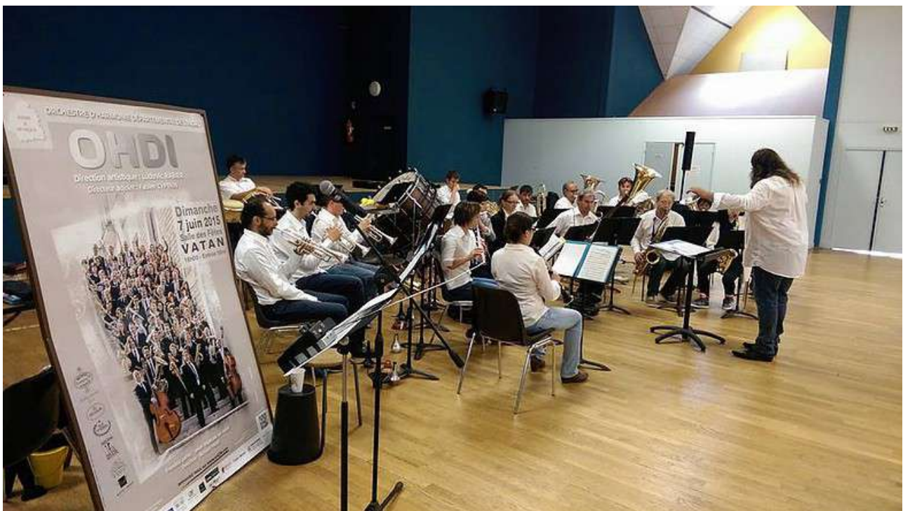
Image d'illustration : animation scolaire primaires – Vatan juin 2015

Les enfants sont alors invités à approcher au plus près les instruments avec pour guide les musiciens de l'orchestre. Ils peuvent ainsi essayer à leur guise, « tester », l'instrument de leur choix, voire tous ! Hautbois, clarinette, flûte, basson, piccolo, saxophones, basses, tuba, cor, trombone et trompette, avec l'ensemble des percussions ! Tout devient propice pour un moment privilégié de découverte, magique, empli d'échanges de joie et de bonheur, instant unique dans lequel l'enfant après avoir été spectateur, investit et s'approprie l'orchestre, en devenant acteur auprès et avec les musiciens de l'OHDI (environ 45').