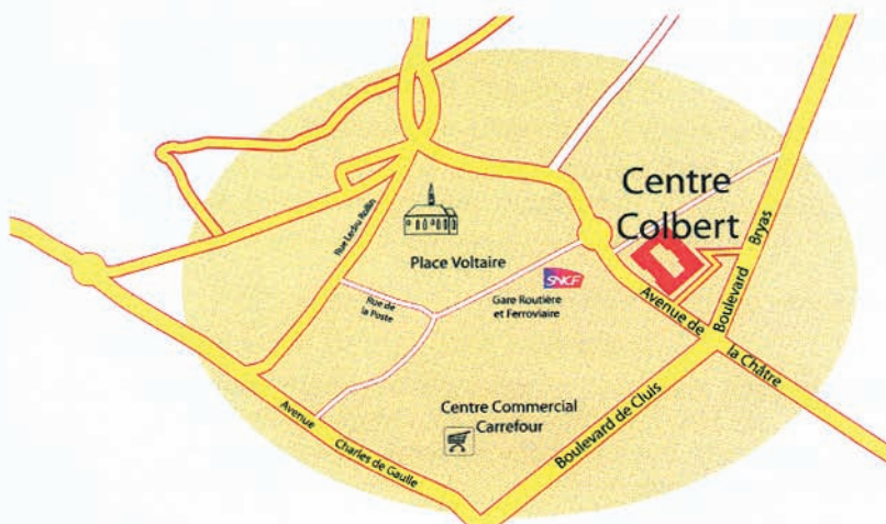
Plan d'accès au Centre Colbert

Horaires d'ouverture de la MDPH : Lundi au vendredi : 8 H 30 à 17 H 15 sans interruption